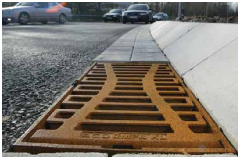
ACO Combipoint trapas 300 x 500 mm