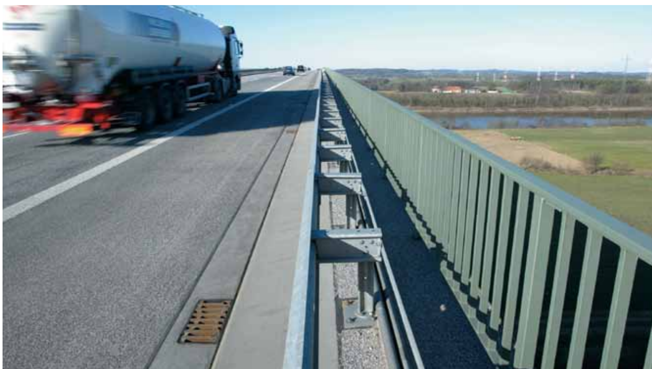
ACO Multitop tiltų trapas