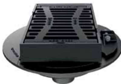
ACO Multitop HSD 2 tiltų trapas