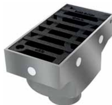
Specialus trapas plieniniams tiltams