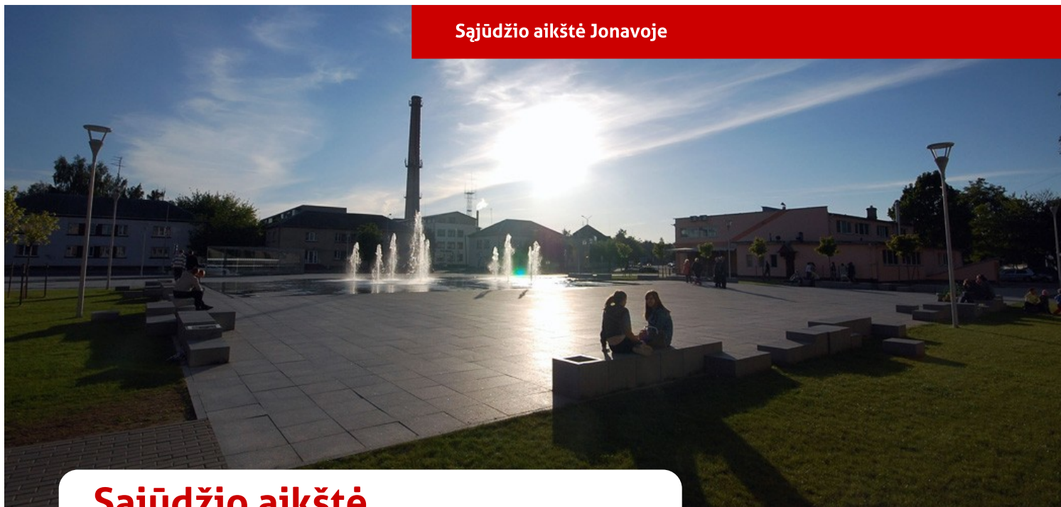
Sąjūdžio aikštė Jonavoje